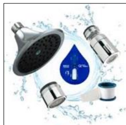
TROUSSE #2 À 7$